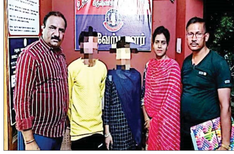
जांजगीर में 02 बालक एवं 05 बालिका, थाना सारागांव में 02 बालिका, थाना चाम्पा में 02 बालक एवं 03 बालिका इस प्रकार विशेष अभियान के तहत बालक 06 एवं बालिका 70 कुल 76 गुम बालक/

बालिका का दस्तयाब किया गया। गुम बालक/बालिकाओं को दीगर प्रांत जम्मू से 06. मध्य प्रदेश से 02. राजस्थान से 01. तेलंगाना से 09. हरियाणा से 01. दिल्ली से 01, कर्नाटक से 01, महाराष्ट्र से 02, उत्तर प्रदेश से 06, पंजाब से 03 एवं छत्तीसगढ़ जिले से 44 बालक/बालिकाओं को बरामद कर उनके परिजनों को सुपुर्द किया गया। जिला पुलिस जांजगीर द्वारा लगातार गुम बालक/बालिकाओं का पातासाजी/दस्तयाबी हेतु हर संभव प्रयास किया जा रहा है।