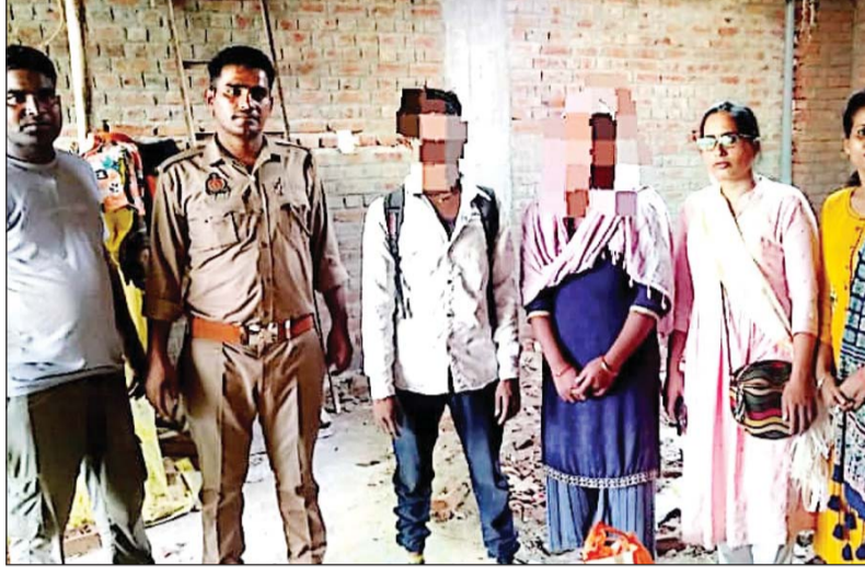
बालिका, थाना बिरा में 02 बालिका, थाना पामगढ़ में 08 बालिका, थाना शिवरीनारायण 14 बालिका, थाना

गठित टीम के द्वारा थाना नवागढ़ में 08 बालिका एवं 01 बालक, थाना बलीदा में 05 बालिका, थाना अकलतरा 14 बालिका, थाना बम्हनीडीह में 01 बालक एवं 03 बालिका, थाना मुलमुला में 06